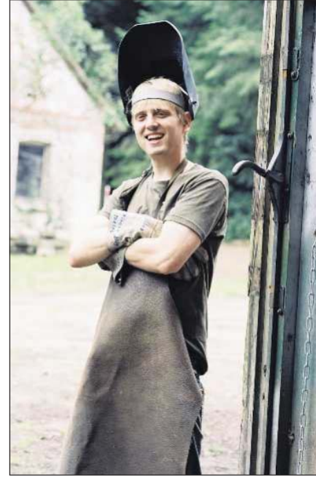
...und jetzt auch ausgezeichneten Initiativen stehen.